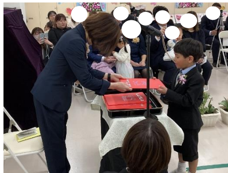
緊張しながらも一人ずつ堂々と卒園証書をもって来ました。