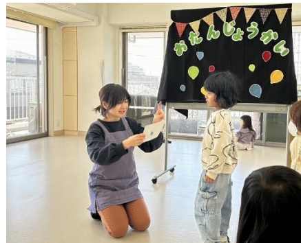
皆勤賞ではカードを買いました！