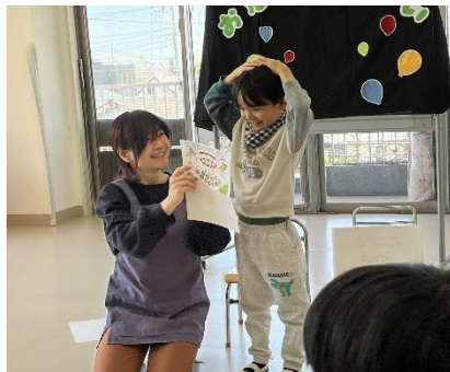
お誕生日カードにどんなことが書いてあったかな？