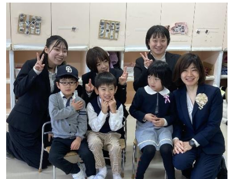
お友達、先生と記念にパシャリ。