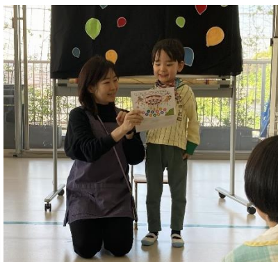
お誕生日カードにどんなことが書いてあったかな？