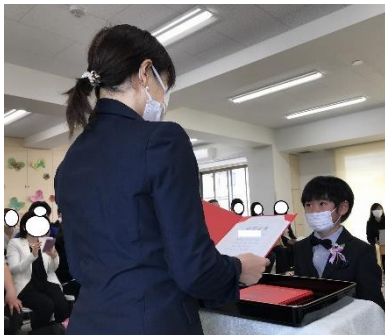
一人ずつ堂々と卒園証書をもっていました。