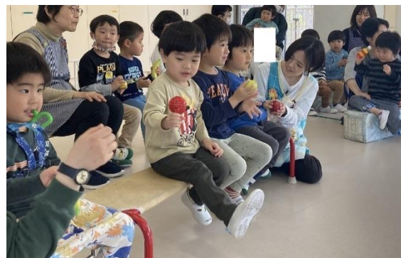
お楽しみでは、みんなで「春が来た」を演奏しました！