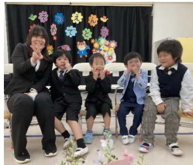
お友達と記念にバシャリ。