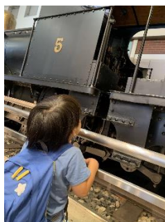
大きな SL 迫力がすごい★