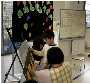
ハロウィンのかぼちゃにお顔を貼り付けました！