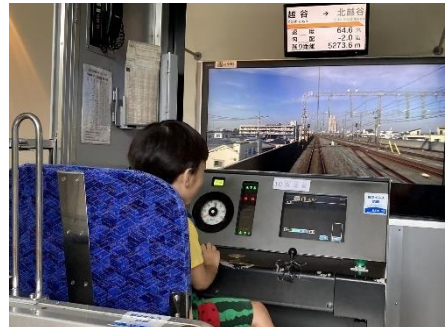
電車の運転！かっこいい！