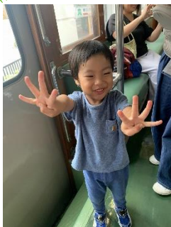
電車の模型に乗ったよー！