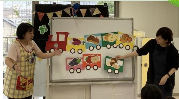
お楽しみは食べ物列車を歌いました☆